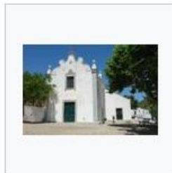
Capela de São Luís